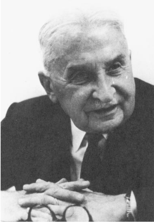
Ludwig von Mises (1881-1973)

niet als koloniaal omschreven kan worden is omstreden. Zo erkenden de Verenigde Naties het recht van Congo om zich los te maken van België als legitiem, maar het recht van Katanga om zich los te maken van Congo niet. 7 Zo is het evenmin zeker of het recht van Vlaanderen om zich los te maken van België door de internationale gemeenschap als legitiem erkend zal worden.