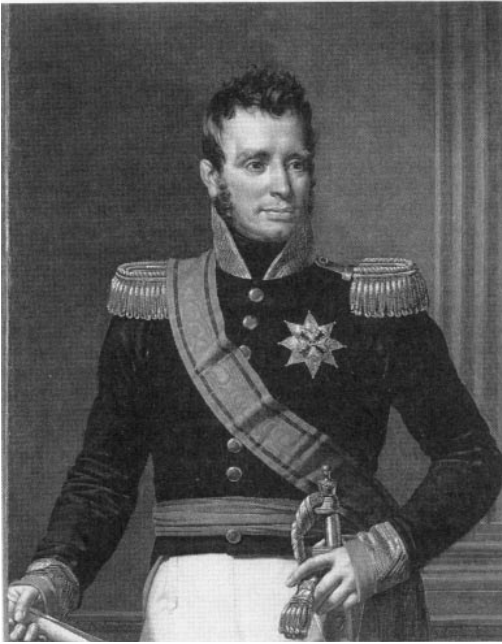
Koning Willem I. De Vlaamse steden maakten in oktober en november 1830 herhaaldelijk duidelijk dat zij zijn onderdanen wilden blijven.

nen mensen bindend zijn? Omdat de Belgische grondwet het daartoe gemachtigd heeft.