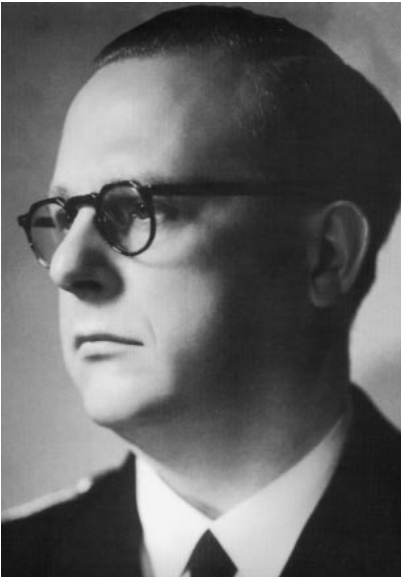
Hendrik Elias (1902-1973).

werken. Hun slaafse onderdanigheid verbaasde de Duitsers. Militärverwaltungs- chef Reeder drukte in zijn Tätigkeitsberichte meermaals zijn verwondering uit over het gebrek aan kritiek vanwege kardinaal Van Roey ten opzichte van de bezetter. Dit stond immers in schrille tegenstelling met de houding van kardinaal Mercier tijdens de Eerste Wereldoorlog.