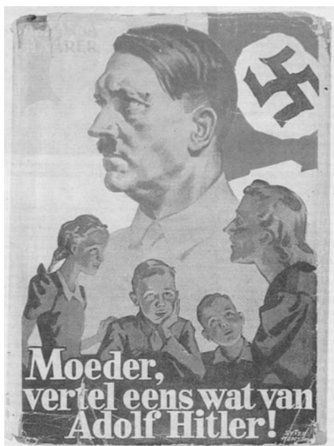
Geen vriend van Vlaanderen.