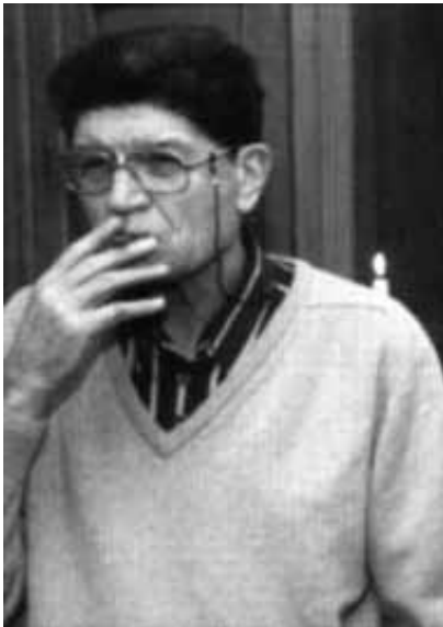
Antoon Roosens (1929–2003)

Steeds ook een doener, is het toch vooral als denker dat Antoon Roosens een blijvende plaats verdient in de geschiedenis van de Vlaamse ontvoogding. En dan wordt het tijd om de inhoudelijke krachtlijnen van zijn denktrant te schetsen. “Waarmee kan ik de door Toon afgelegde weg beter samenvatten dan met deze ontwikkelingsgang: van taal- en cultuurflamingantisme, over sociaal-flamingantisme en federalisme, naar het Gramsciaans marxisme,