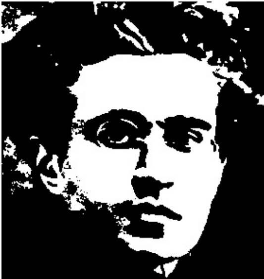
Antonio Gramsci (1891–1937)

Zeggen we hier vooreerst dat Roosens in zijn latere leven, erkende dat het liberaal democratisch model onbetwistbaar voor de betrokken volkeren in de Westerse wereld een nooit gekende welvaart en democratische participatie gebracht heeft. Terugblikkend op het verleden verbaasde Roosens zich erover dat het kapitalisme nooit zozeer in vraag gesteld werd, als op het hoogtepunt van zijn bloei en verwezenlijkingen, in de golden sixties . Gedurende een