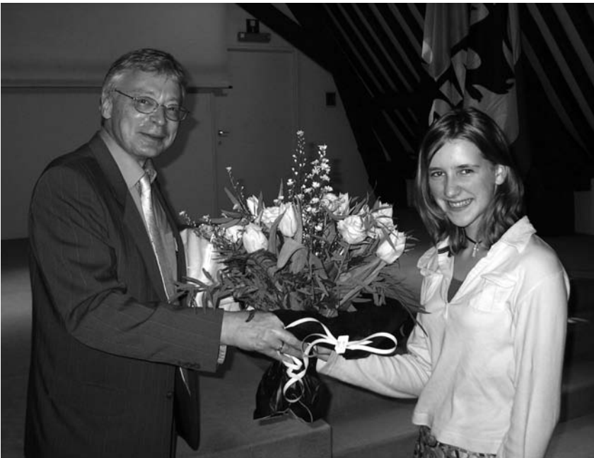
Hans-Hermann Hoppe in Antwerpen.

Staten zullen altijd trachten om hun belastinginkomsten te verhogen en hun binnenlandse bemoeienis en regulering uit te breiden. Hierdoor komen ze evenwel in conflict met andere, concurrerende staten. De wedijver tussen staten als territoriale entiteiten met een dwangmonopolie is per definitie eliminerend. In een bepaald territorium kan er immers maar één entiteit zijn die over het monopolie van dwang beschikt en belasting heft. De concurrentiestrijd tussen verschillende staten leidt er dus toe dat er een tendens bestaat naar een verhoogde politieke centralisering en uiteindelijk naar één enkele wereldstaat.